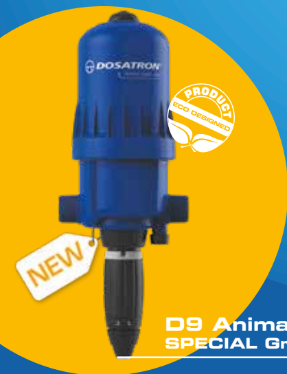
D9 Animal Health Line SPECIAL Grands Bâtiments